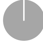
2. Afstemming op taxonomie van beleggingen exclusief overheidsobligaties*

■ Afgestemd op de taxonomie (0%) ■ Overige beleggingen (100%)